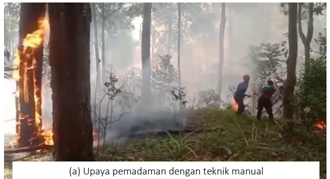
(a) Upaya pemadaman dengan teknik manual

Berbagai upaya pemadaman api dilakukan oleh staf HPGW bekerjasama dengan pihak relawan, Damkar, kepolisian, TNI, polisi hutan (polhut), pramuka, dan masyarakat sekitar HPGW. Karena kondisi lapangan yang cukup curam dan tidak memungkinkan mobil pemadam kebakaran menjangkau lokasi kejadian, maka pemadaman api dilakukan secara manual dengan menggunakan alat garuk penyekat api, ranting/cabang pohon, alat semprot gendong, menaburkan tanah, dan membuat sekat-sekat bakar. Berkat upaya dan kerja keras semua pihak, kobaran api berhasil dipadamkan pada pukul 17.00 WIB walaupun masih menyisakan bara-bara api di beberapa areal.