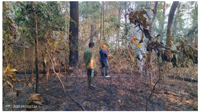
Gambar 2. Kondisi tumbuhan bawah dan tegakan pinus yang terbakar di HPGW

Berbagai upaya pemadaman api dilakukan oleh staf HPGW bekerjasama dengan pihak relawan, Damkar, kepolisian, TNI, polisi hutan (polhut), pramuka, dan masyarakat sekitar HPGW. Karena kondisi lapangan yang cukup curam dan tidak memungkinkan mobil pemadam kebakaran menjangkau lokasi kejadian, maka pemadaman api dilakukan secara manual dengan menggunakan alat garuk penyekat api, ranting/cabang pohon, alat semprot gendong, menaburkan tanah, dan membuat sekat-sekat bakar. Berkat upaya dan kerja keras semua pihak, kobaran api berhasil dipadamkan pada pukul 17.00 WIB walaupun masih menyisakan bara-bara api di beberapa areal.