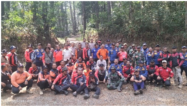
Gambar 4. Para relawan dan petugas gabungan

Berdasarkan hasil pemetaan di lapangan, areal HPGW yang terbakar seluas 3,9 ha (sekitar 1%) dari total luas kawasan HPGW (359 ha). Kebakaran tersebut menimbulkan berbagai tingkat kerusakan pada lantai hutan dan tegakan pinus (sekitar 600 pohon) yang menjadi areal sadapan masyarakat sekitar HPGW. Penyebab kebakaran diduga karena pembukaan lahan oleh masyarakat penggarap lahan kosong yang berbatasan dengan HPGW. Perlu investigasi lebih lanjut untuk memastikan penyebab kebakaran secara pasti.