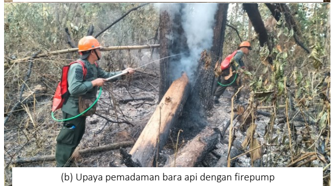
(b) Upaya pemadaman bara api dengan firepump